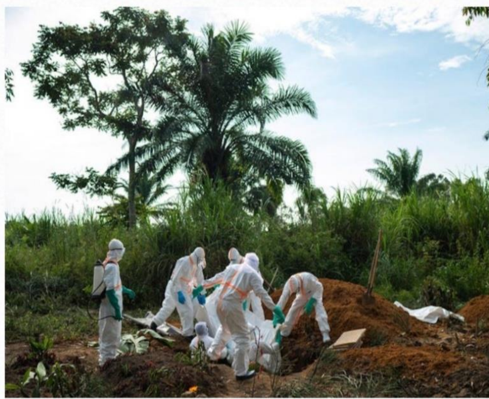
Kongo'da işçiler bir Ebola kurbanını gömüyorlar.